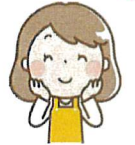
こずえちゃん 延岡市出身

そういう場所を仲間たちと 作って運営してきました。 子育て中の方がホッとでき る居場所になれたらうれし いです。